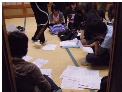
籠原ウォークラリー 2013